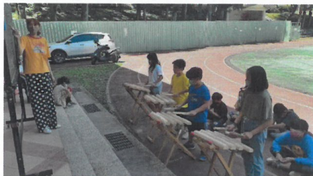
說明：傳統木琴歌謠