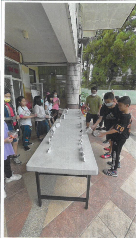
說明：自然科學—空氣砲