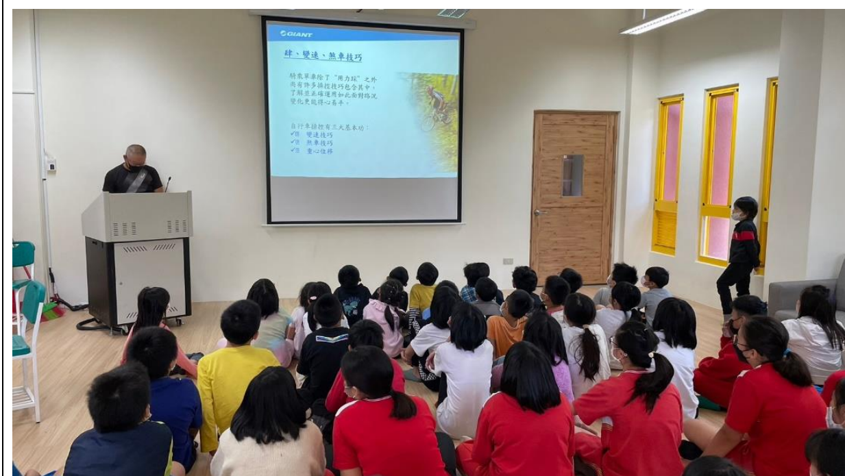
說明：11/21 自行車安全宣導。