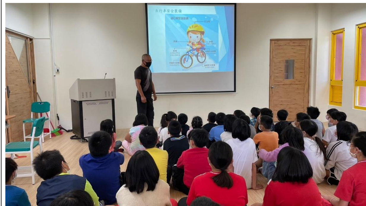
說明：11/21 自行車安全宣導。